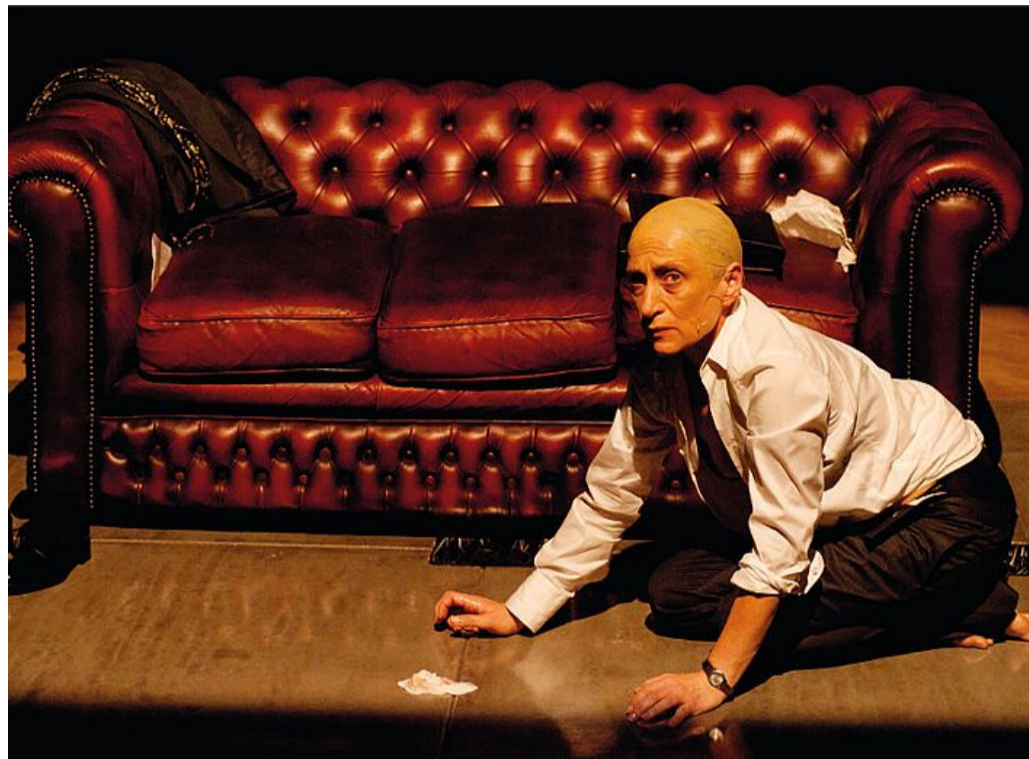
Una scena dai "Racconti africani da Shakespeare", debutto nazionale di Krzysztof Warlikowski