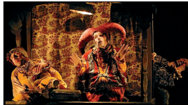
I fratelli Forman in "Obludarium"

re" dalle parole di Shylock del Mercante di Venezia, si chiede seduta di fronte a noi cosa sia un uomo, quando perde la facoltà delle passioni. Il teatro è un imbroglio, dice, eppure ecco comparire in lei il cieco Gloucester del Re Lear, a cui viene fatto credere (come a teatro!) di potersi suicidare da una scogliera che in realtà non esiste. Eppure Brook ricorda che Dio stesso ha creato il teatro, "il settimo giorno dopo che è subentrata la noia". Saranno gli uomini a farne le regole, a litigarsi i ruoli e innalzare muri, come nella vita. Un nuovo intervento divino è in una domanda su un foglietto: il foglio però è andato smarrito, non sappiamo più quali saranno le sorti del teatro, non abbiamo ricette pronte, e forse se qualcuno lo trovasse non gli crederemmo. Come nel mondo in cui viviamo?