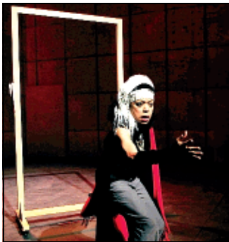
Warum Warum di Peter Brook

quasi per sondare il richiamo di un'urgenza che lo porterà a fondare un centro di ricerca a Parigi e a partire per l'Africa. Si può dire che Brook sia stato il più importante regista shakesperiano del '900, almeno dal "Sogno di una notte di mezza estate" del '71, senza scenografie e con trapezi da circo; e il "Mahabharata" del 1985, che in nove ore incrociava tradizioni e codici molteplici, uno degli spettacoli cruciali del secolo scorso. Oggi continua a meravigliarci la rarefazione estrema dei suoi lavori, e la straordinaria capacità degli attori di "essere", praticamente da soli.