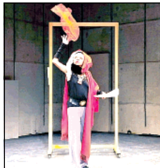
Warum Warum di Peter Brook

ripercorrere l'interrogativo, per riecheggiare le parole di Mejerchol'd, Craig, Dullin, Artaud, o ancora di Zeami Motokiyo, maestro del teatro No giapponese, e dell'amatissimo Shakespeare, in un personale montaggio di testi fondato sul dubbio. "Perché? Perché?", è infatti la traduzione di Warum Warum, spettacolo in nome o piuttosto in cerca, di quelle domande che da sempre tengono in vita la creazione. A ospitare l'evento in prima nazionale il Salone delle feste di Correggio, novità quest'anno tra le città protagoniste di Vie. La scelta,