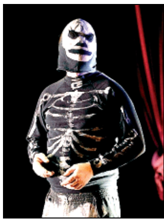
Una scena da Spectacular

Il performer imbarazzato e mascherato da scheletro di "Spectacular" rappresenta l'incipit di quest'ultima produzione. Lo spettacolo non tradisce quella che è la poetica del gruppo di Sheffield, forte d'una spiccata propensione per la provocazione, ma allo stesso tempo attenta all'intimità che è possibile stabilire con chi guarda. Viaggiando tra stili espressivi opposti quali l'ironia e la banalità prosaica, i Forced Entertainment hanno dato vita a un linguaggio che si nutre di intuizioni e impulsi creativi provenienti dalle arti visive e dall'utilizzo di tecnologie multimediali, passando per l'uso di installazioni e strutture drammaturgiche più afferenti all'ambito teatrale. In questo modo la compagnia è diventata una delle più note in Europa per un linguaggio capace di dissodare in modo unico il terreno in cui far crescere la cosiddetta performance, per antonomasia luogo di incontro tra forme eterogenee. Gli spettacoli nascono da un fitto momento di elaborazione col-