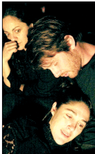
Neva del Teatro en el blanco

(visto quest'anno al festival Today is Ok organizzato da Xing a Bologna) sono entrambi lavori di una durata di 6 ore. Nel primo, in cui il pubblico ha libertà di scelta in merito ai tempi di permanenza in sala, vengono problematizzati i processi identitari, indagando le relazioni fra l'immagine e il testo; il secondo cala il format del quiz in una