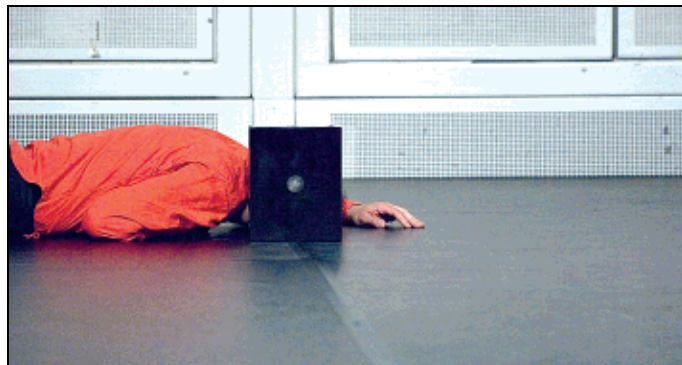
Un momento dall'opera teatrale 'Huyh'