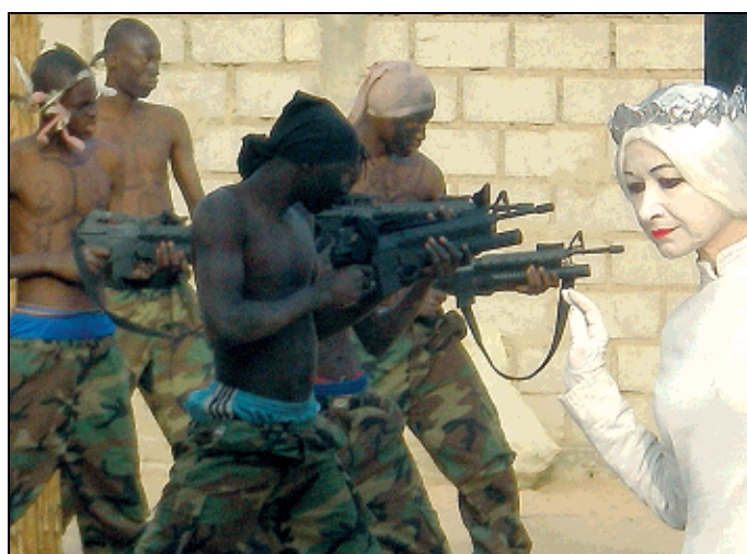
Una scena tratta dallo spettacolo 'Ubu'

realtà legato all'abuso che spesso si fa di questo termine: bisogna rinnegare la parola innovazione per poi riconquistarla. Innovare significa presentare nel contemporaneo i lavori di nicchia, qualcosa che sta nascendo e potrà avere uno sviluppo. La contemporaneità può essere una categoria? Oppure non c'è una categoria che la possa contenere? Per me è un modo di essere, un modo di vivere». (alice fumagalli e francesca giuliani)