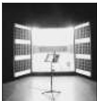
Un'immagine di scena

La dinamica è semplice: un uomo pone domande, un altro risponde. I due sono collegati da un sistema di elettrodi. Il primo può dare una scossa elettrica al secondo quando sbaglia le risposte. Il primo è un uomo comune, e non sa che il secondo è un attore che simula gli effetti della scossa. Gli viene detto che responsabilità e conseguenze dell'esperimento ricadono sull'autorità competente. Nel 1962 Stanley Milgram, psicologo sociale e ricercatore statunitense, condusse questo celebre esperimento presso l'Università di Yale, per verificare il livello di aderenza agli ordini impartiti da un'autorità,