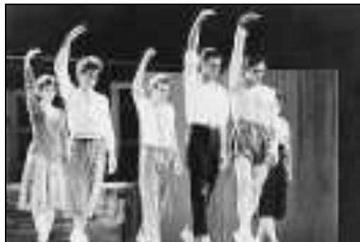
Una scena da 'Il Cortile'