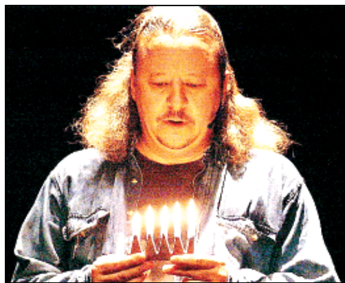
Una scena di "Generation Jeans" della compagnia Belarus

Prosegue l'appuntamento con il Belarus Free Theatre, punta di diamante di quest'edizione del Festival, che presenta "Generation jeans" all'ITIS Fermo Corni di Modena, oggi alle 20 e giovedì alle 17. Dopo "Discover Love", la tragica storia d'amore del giornalista oppositore al governo bielorusso di Lukaëenko, dopo la lucida analisi sulle contraddizioni e i rapporti tra drammaturgia, verità e arte di "Being Harold Pinter", o ancora le sconcertanti testimonianze di "Zone of Silence", eccoci di nuovo con il clandestino teatro di Minsk ad ascoltare il grido di ribellione di una generazione che ha scelto, non senza rischi, di voltare le spalle alla dittatura. Un simbolo epocale, lo